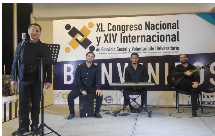
Grupo acústico de la Coordinación Gral. de Extensión de la Cultura URS